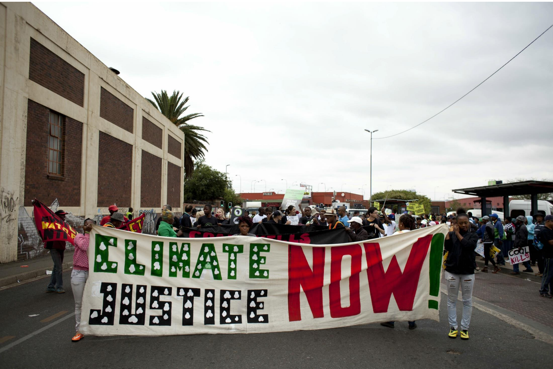
Bildquelle: Misereor / Oupa Nkosi, Südafrika 2015