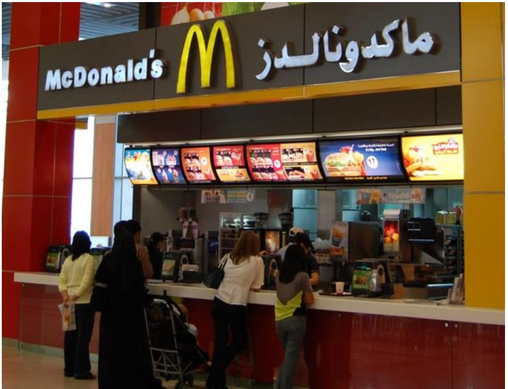
Bildquelle: RuK/ Wikimedia Commons