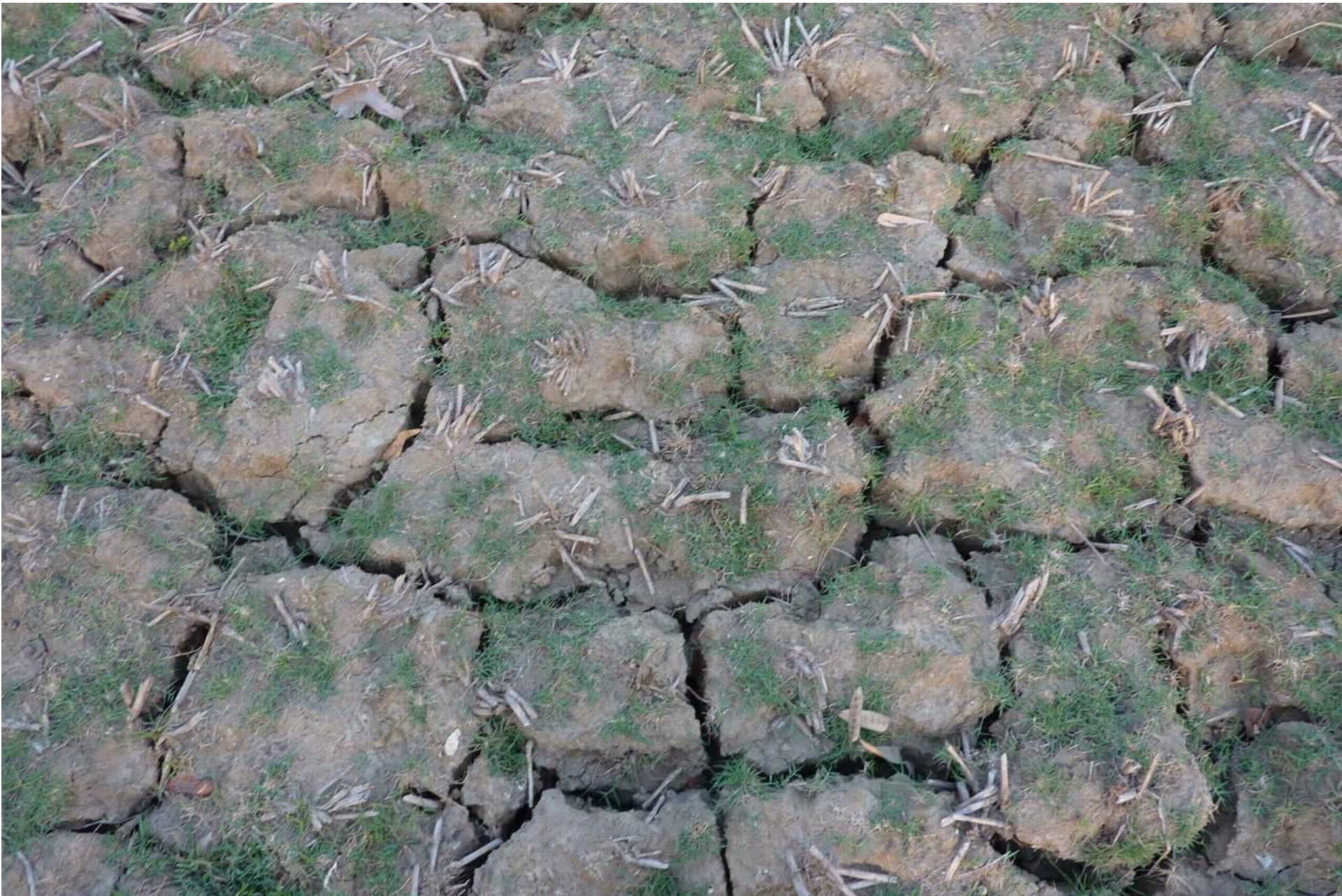
Bildquelle: Misereor/ Manuela Ott, Bangladesch 2011